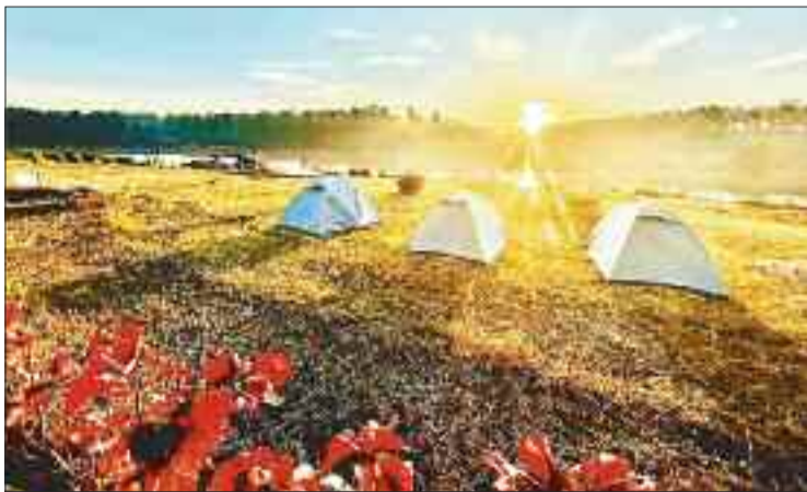
कार्निवाल स्थल पर पर्यटकों के लिए सजाए गए टेंट।