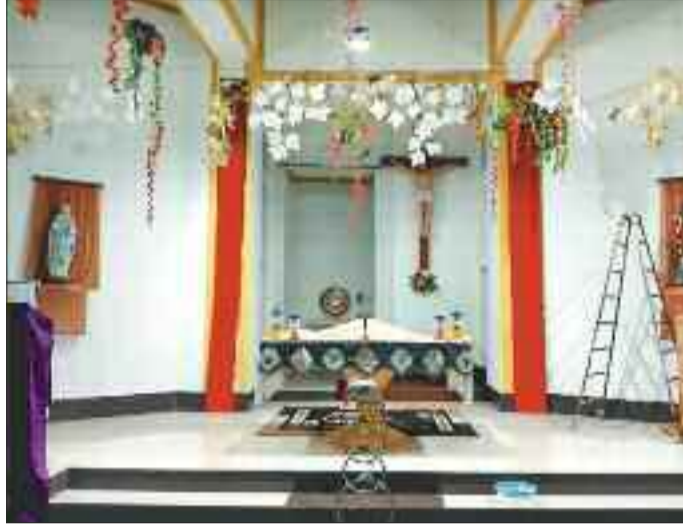
क्रिसमस पर्व पर सजाया गया चर्च।

मसीही समाज द्वारा क्रिसमस का पर्व 24-25 दिसंबर की मध्य रात्रि में उल्लास के साथ मनाया गया। 25 दिसंबर को दिनभर क्रिसमस के उल्लास में समाज के लोग जुटे रहेंगे। आज के दिन प्रभु यीशु के जन्म की खुशियां घर-घर बिखरी रहगी और दिनभर विभिन्न तरह के व्यंजनों का लुत्फ उठाया जाएगा, इसमें परिवार के लोगों के साथ शुभचिंतकों को भी दावत में शामिल किया जाएगा। क्रिसमस के दिन से शुरु हुआ उल्लास आगामी एक सप्ताह तक चलेगा, यानी नए साल तक प्रभु यीशु के जन्म की खुशियां मनाई जाती रहेंगी। मिली जानकारी के अनुसार बीते 24 दिसंबर की रात्रि में शहर से लगे रामपुर स्थित रोमन कैथोलिक गिरजाघर में मसीही समाज के लोग काफी संख्या में जुटे। इस दौरान पूरे गिरजाघर में उमंग उल्लास का माहौल बना हुआ था, इसी बीच मध्य रात्रि में प्रभु यीशु के जन्म की ख़ुशी जैसे आई वैसे ही गिरजाघर का घंटा बजने लगा, विद्युत झालरों के बीच कैंडल की रोशनी भी बिखर गई। इसके साथ ही जुटे समाज को फादर के द्वारा बाईबिल का संदेश पढ़कर सुनाया गया। इस दौरान उपस्थित लोगों के द्वारा विशेष आराधना प्रभु यीशु के जन्म को लेकर शुरू की गई। मध्य रात्रि तक प्रभु यीशु के जन्म के ख़ुशी में मसीही समाज के लोग ठंड की परवाह किए बिना ही परिवार के सदस्यों के साथ