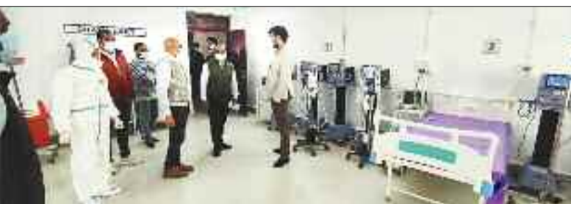
व्यवस्थाओं का जायजा लेते जिप सीईओ